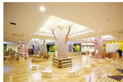
■ 子育てふれあい交流プラザ「元気のもり」