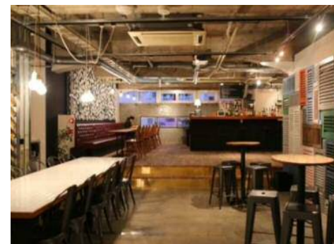
■ Tanga Table