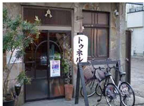
■ ゲストハウス「トゥネル」