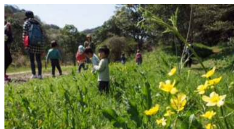
■ 育児サークル「響の森」