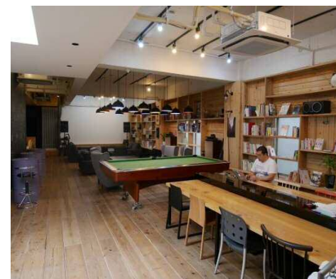
■ コワーキングスペース「秘密基地」